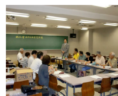
7月3日阪和部 EMC委員長会

退会者続出! 一から出直し! 危機感を持とう! EMCビジョンを語り将来のクラブ像を確立しよう! 限なきワイズの拡がりを求めて永遠に!