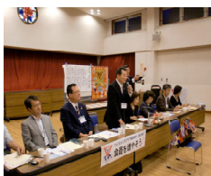
7月15日和歌山クラブ例会に 参加してEMCについてスピーチ