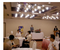
7月17日四日市クラブ 入会式 1名