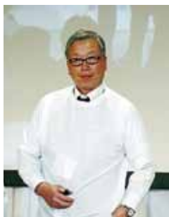
10月27日(日)のワイズデーに行われるギネスに挑戦をアピールする香山地域奉仕・環境事業主査

させて頂けて良かったと思う日でもありました。と、言いますのも他クラブの皆さまとはまだ交流もなく、感じた雰囲気だけの事なのですが、キャピタルクラブの皆さまと波長が合うと言いますか、あたたかく感じる良いクラブだと思いました。そしてまた、各クラブで新規会員を増やしていこう！更に強力に活動して行こう！と、意気込みも感じ、今後の自分のワイズメンとしての活動に向けて色々考えたり、一際気合いの入る一日となりました。