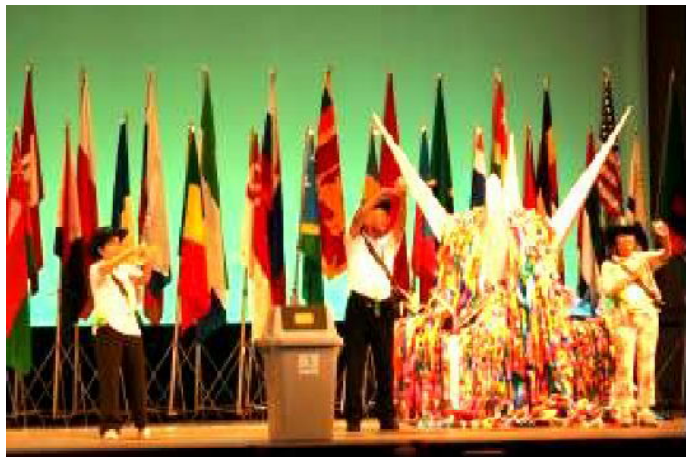
グリーンシェリフ(環境保安官)のアピール。

ピエロになりきろうと気持ちを切りかえました。グリーン帽子もなかなか決まっています。ミッションが下される度に仲間の皆さんと盛り上がり、結構楽しんで4日間を過ごしました。クレームが来たり、理不尽に上から目線で怒鳴られてアタマに来たこともありましたが、今回初めて顔を合わせた方々と親しくなれたことは大きな収穫でした。