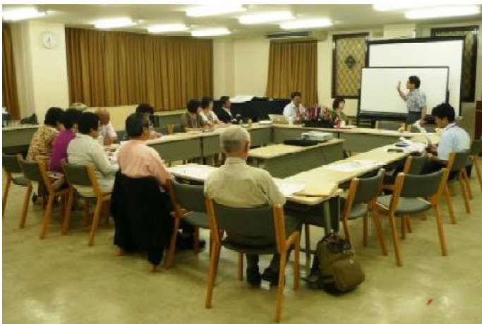
熱心に卓話に聞き入っていました。

神経の通り道を確保していると云うことを、当たり前のことなのですが、如何にふだん意識しないで生活しているかを再認識。無意識のうちに弱いところを庇ったり、楽な姿勢を求めているのですが、これが健康のために良くないという事がよく分かりました。目下、横浜国際大会に向けて社交ダンスや盆踊りをレッスン中ですが、このお話を伺ってから、練習時に背筋を伸ばして踊ることで余裕のステップに近づいている様子です。横道にそれましたが、持参されたレジメや図表を配布され、骨のカットモデルを手を持たせて頂き、先生のお話は背骨のはなしから始めて、自律神経を司る原始的な脳のお話、大切な毛細血管のお話、脳下垂体のお話などバラエティーに富んでいて、止まることを知りませんでした。お話のつづきは先生の施療院へ行ってこの先を伺うこととして、次のプログラムへ移りました。