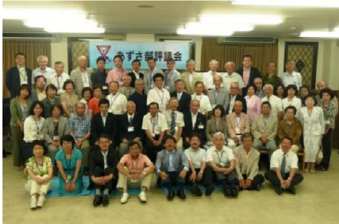
昼食・懇親会の前に全員で記念撮影をしました。

部長挨拶・小山部長所信表明・事業主任/クラブ会長所信表明・議案審議・諸報告と連続していたのですが、皆さんタイムキーパーのサイン通りに時間内に滞りなく済んだのでした。