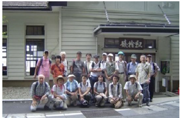
出発前に姨捨の駅で記念撮影。

今回篠ノ井線の姨捨駅に10時45分に集合し稲荷山駅までゆっくり、のんびり、楽しいおしゃべりをしながら歩きました。