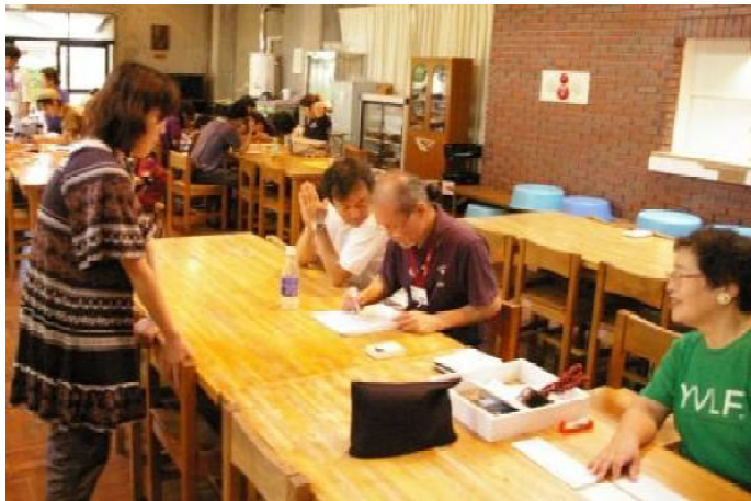
報告書と引き替えて交通費の精算