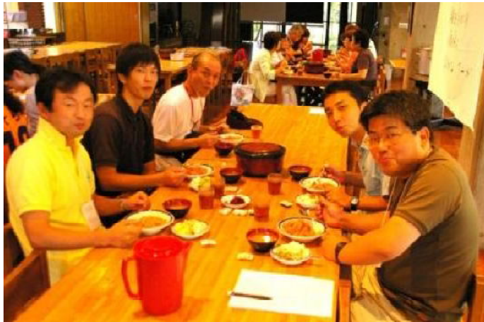
スタッフ食事風景 むこうのテーブルは見学ワイズ

今、報告書を編集担当としてまとめているが、毎年誰よりも早く全員自筆の報告書に触れることの出来る喜びを感じているところだ。