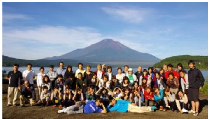
富士山バックに記念撮影