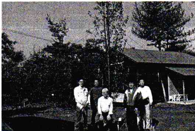
ハナナシってどんな木なの？

フレンドシップハウスの前に、しっかり植えてあります。これから5年、10年経ったら、きっと素敵な大木になるでしょう。みんなで水をやりにいきましょう。そしてハナナシの花を咲かせましょう！