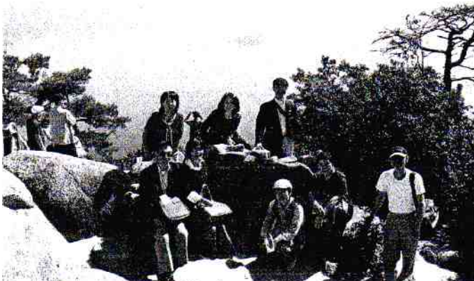
左に能美島をバックに、獅子岩の前で。

10月にしては汗ばむような陽気だったのですが、フェリーの船上では涼しい海風を楽しむことができました。宮島ではお土産や昼食を後回しにして、シャトルバスで厳島神社の裏にあるロープウェイの駅へ。意外に混んでいて30分ほど並ばされました。2つのロープウェイを乗り継いで獅子岩へ。弥山の頂上へはそこから片道25分掛かるのであきらめ、獅子岩からの瀬戸内海や四国山脈の眺望を楽しみ、みんなで記念写真を撮りました。